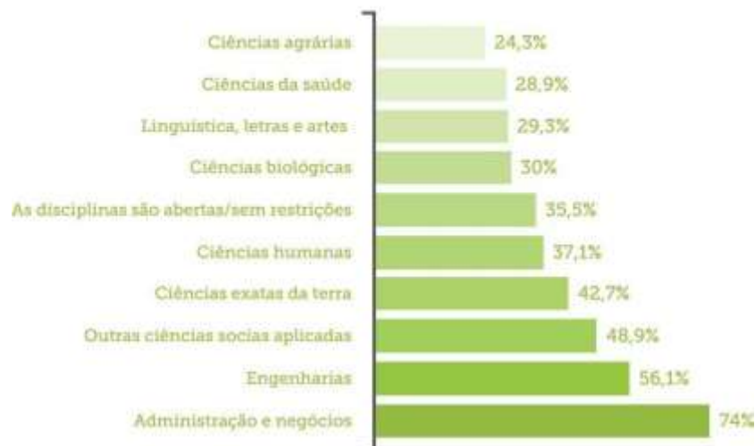
Figura 2. Percentual de oferta de disciplinas de empreendedorismo por área de conhecimento – 2016.